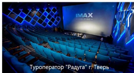
Туроператор "Радуга" г. Тверь

07.45 Подача автобуса к школе. Встреча с экскурсоводом, посадка на автобус. 8.00 выезд из Твери. В автобусе экскурсовод свои рассказом подготовит детей к экскурсии.