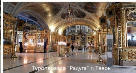
Туроператор "Радуга" г. Тверь

07.45 встреча с экскурсоводом у школы, посадка на автобус. 8.00 выезд из Твери. В автобусе экскурсовод свои рассказом подготовит детей к экскурсии.